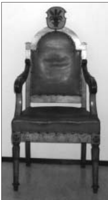
Stol för häradshövdingen.

Anm. I vissa mål tillföll en del av böterna häradshövdingen som tjänstearvode. Vid treskiftes bot delades böterna mellan kronan, häradshövdingen och målsägaren. Avskrivet och "tolkat" i nov. 2004. Sture Appelblom