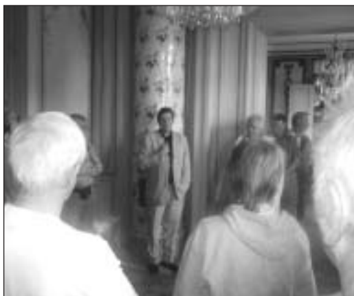
Vår guide framför en av de fina kakelugnarna på Sturehofs slott.