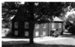
Vår hembygdsgård vid Tonesunds kyrka

Postadress: Sörliden 640 61 Stallarholmen Info: 0152-40557, Postgiro 41 71 07-0 Epost: hembygd@stallarholmen.com Hemsida: www.stallarholmen.com/hembygd