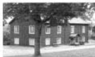
Vår hembygdsgård vid Torelands kyrka

Postadress: Sörliden 640 61 Stallarholmen Info: 0152-40657. Postgiro 41 71 07-0 Epost: hembygd@stallarholmen.com Hemsida: www.stallarholmen.com/hembygd