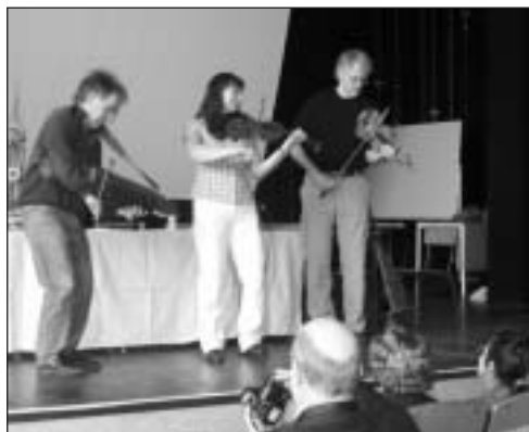
Familjen Odén underhåller på grötaftonen.

Vi i styrelsen hoppas att de aktiviteter vi ordnat har uppskattats av våra medlemmar. Har någon förslag på någon utflykt eller något som ni tycker vi borde ägna oss åt så hör av er. Adresser hittar ni i årsskriften.