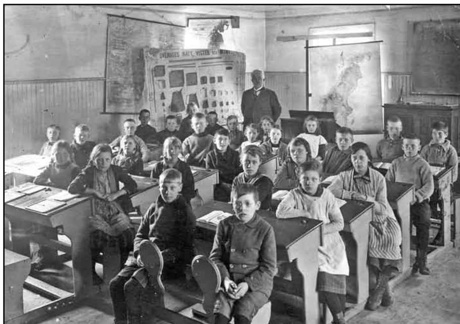
Skolklass i Toresunds kyrkskola åren 1923–24. Känner du igen någon på bilden?