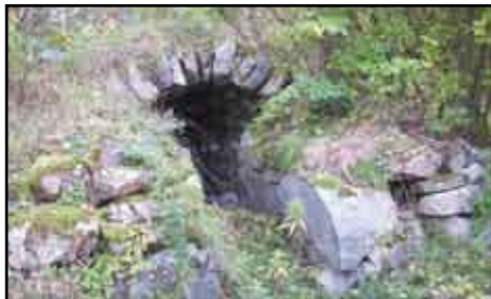
Källaren vid torpet 743 i Sursa

1859 den 2:dra sept. hade jag nåden att personligen träffa Eder Kongl. Majst. vid Ulriksdahls slott och hvarvid Eder Majst. behagade genomse mina papper, och dervid gaf mig löfte om påökning af mitt underhåll, samt tillsägelse att aflämnas mina papper till vid slottet tjensgörande herre, hvarvid jag vid återkommandet erhöll 30 Rd. samt tillsägelse att aflämnas dem på ett embetsverk, hvars namn mig är obekant, der fingo de qvarliga ett helt år då jag fruktade att inte återfå dem, hvarföre jag reste upp till Stockholm och efterfrågade på ofvannämnde embetsverk, der jag återbekom dem men ännu har jag ej fått någon påökning.