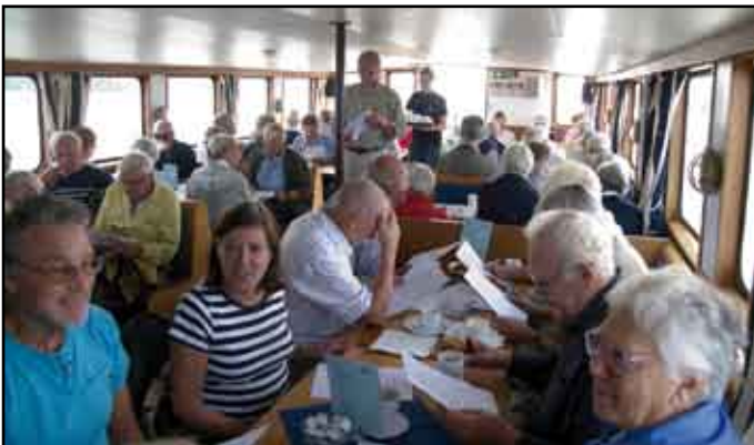
Så här trevligt hade vi det ombord på Tor när vi åkte till Vällinge i Botkyrka

Sommarmarknad med auktion – stånd med pilkastning – chokladhjul – barnridning – fiskdamm – porslinskrossning – lotterier – fyndvaror – honung – torpinformation – Sjöbris – kaffe – våfflor – bjuda in lokala aktörer – utställning – vårt museum – fler idéer!!!! OBSERVERA ATT PROGRAMMET ÄR IDÉER OCH TANKAR SOM SKALL UTFORMAS TILL ATT BLI EN INNEHÅLLSRIK DAG. VÄLKOMMEN MED FÖRSLAG!